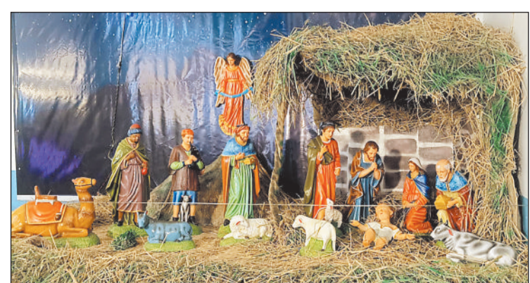
समुदाय ने क्रिसमस मनाया। विश्वासगढ़, रामभाटा, बोईदादर स्थित गिरजाघरों में रविवार को सुबह से ही पूजा और सेलिब्रेशन शुरू हो गया था। रात को मसीही समाज के लोगों ने केक काटकर प्रभु यीशु का जन्मोत्सव मनाया। शहर के विश्वासगढ़ चर्च के साथी मिशनरीज का चैरिटी के गिरजाघर में भी प्रभु यीशु के जन्मोत्सव की धूम रही। आधी रात को शहर के गिरजाघरों में ईसाई काउंसिलिंग की गई।

क्रिसमस से एक दिन पहले बुधवार को गिरजाघरों में आधी रात प्रभु यीशु का जन्म हुआ। प्रभु यीशु के जन्म का उत्साह मनाने विभिन्न आयोजन व कार्यक्रम हुए। शहर के विश्वासगढ़ चर्च में रात 11 बजे तक नाटक मंचन व सांस्कृतिक कार्यक्रम हुआ।