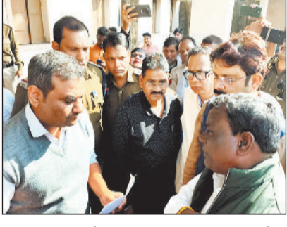
शहर के कबीर चौक स्थित किसान राइसमिल के पास बन रहे ऑक्सीजन पेड़ों की अवेध कटाई और खड़ी बाउंड्रीवाल तोड़ने को लेकर जिला कांग्रेस द्वारा विरोध प्रदर्शन करते हुए एसडीएम को ज्ञापन सौपा गया। ज्ञात है कि वर्तमान में शहर के कई स्थानों पर ऑक्सीजन बनाने का काम चल रहा है। इसी के तहत शहर के कबीर चौक के किसान राइसमिल के पास भी ऑक्सीजन का निर्माण किया जा रहा है। ऑक्सीजन के निर्माण के लिए यहां बूटले से मौजूद पेड़ों को काटा जा रहा है, जिसका विरोध करते हुए जिला कांग्रेस द्वारा एसडीएम को ज्ञापन सौपा गया ज्ञापन सौंपते हुए कहा गया कि कबीर चौक में ऑक्सीजन के नाम पर बस पैसों की बर्बादी की जा रही है। हरे भरे पेड़ों को काट कर कंक्रीट का ऑक्सीजन बनाया जा रहा है। ऑक्सीजन के लिए वहां पर पहले से जो पेड़ हैं उन्हें क्यों काटा जा रहा है, क्या उससे हवा नहीं मिलता था, वहीं उस स्थान पर जो बाउंड्रीवाल थी उसका भी प्रयोग किया जा सकता था, लेकिन बेवजह उसे भी तोड़ दिया गया, यह सब सिर्फ पैसों की बर्बादी है। कांग्रेस ने ज्ञापन के माध्यम के कहा गया कि ऑक्सीजन बनाने वाले स्थान पर पहले से ही सागौन के बड़े-बड़े पेड़ स्थित थे, जिसे काट दिया गया। जबकि सागौन जैसे पेड़ों को काटने से पहले परमिशन ली जाती है।