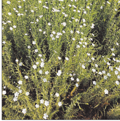
बीज में कोई कमी थी या फिर किसानों से ही देना मुनासिब नहीं समझा। इस पूरे खेती कराने के बाद उनकी फसल का दाम

साढ़े 8 हजार किंवदंल के हिसाब से खरीदी करने का वादा करके बीज निगम ने तीन गांव के 19 किसानों से करीब 100 एकड़ में अलसी की खेती कराई थी। किसानों द्वारा अलसी बीज उत्पादन कार्यक्रम के तहत यह खेती की गई थी, लेकिन जांच में पुरा बीज ही फेल हो गया। हालात यह है कि किसानों की अब अलसी बीज व्यापारियों को औने-पौने दाम में बिक्री करना पड़ रहा है। याने इस सरकारी कार्यक्रम में किसानों को लाखों का नुकसान हो गया है। दिलचस्प बात यह है कि जो बीज किसानों ने खेतों में बोई थी वह भी सरकारी ही था। ऐसे में या तो सरकारी